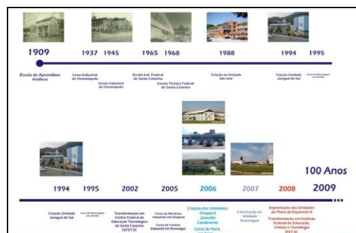
Figura 1.1: Evolução histórica do IFSC

Com a transformação em CEFET/SC as atividades foram ampliadas e diversificadas, especialmente com a implantação de cursos de graduação tecnológica, cursos de pós-graduação em nível de especialização e a realização de pesquisa e de extensão.