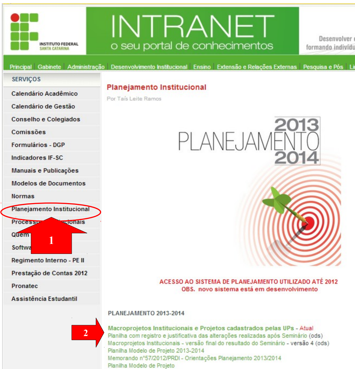
Figura 2 – acessar intranet.ifsc.edu.br, clicar em Planejamento Institucional no menu de serviços e baixar planilha Macroprojetos e Projetos Cadastrados pelas Ups.

planejamento, para melhor alinhamento metodológico e relacionamento entre planos de ação e previsão orçamentária, visando a, especialmente, apoiar a montagem da Programação Orçamentária do IFSC para 2014.